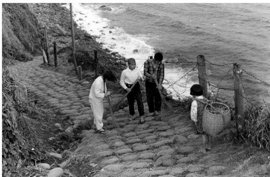
← 昭和30年代の清掃風景 (海岸への道)

この度、公益財団法人修養団が主催する「第6回SYDボランティア奨励賞」において、長年の活動実績が高く評価され、優秀賞を受賞することとなり、クリスタルトロフィーならびに副賞を贈呈されました。