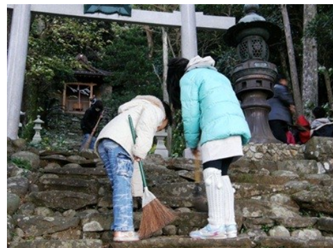
現在の清掃風景 → (神社)