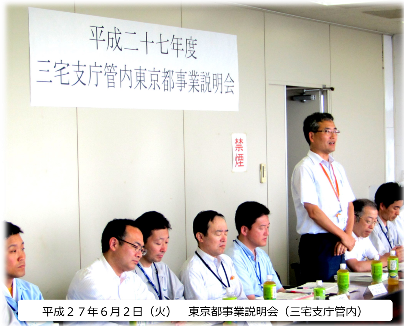
平成27年6月2日(火) 東京都事業説明会(三宅支庁管内)