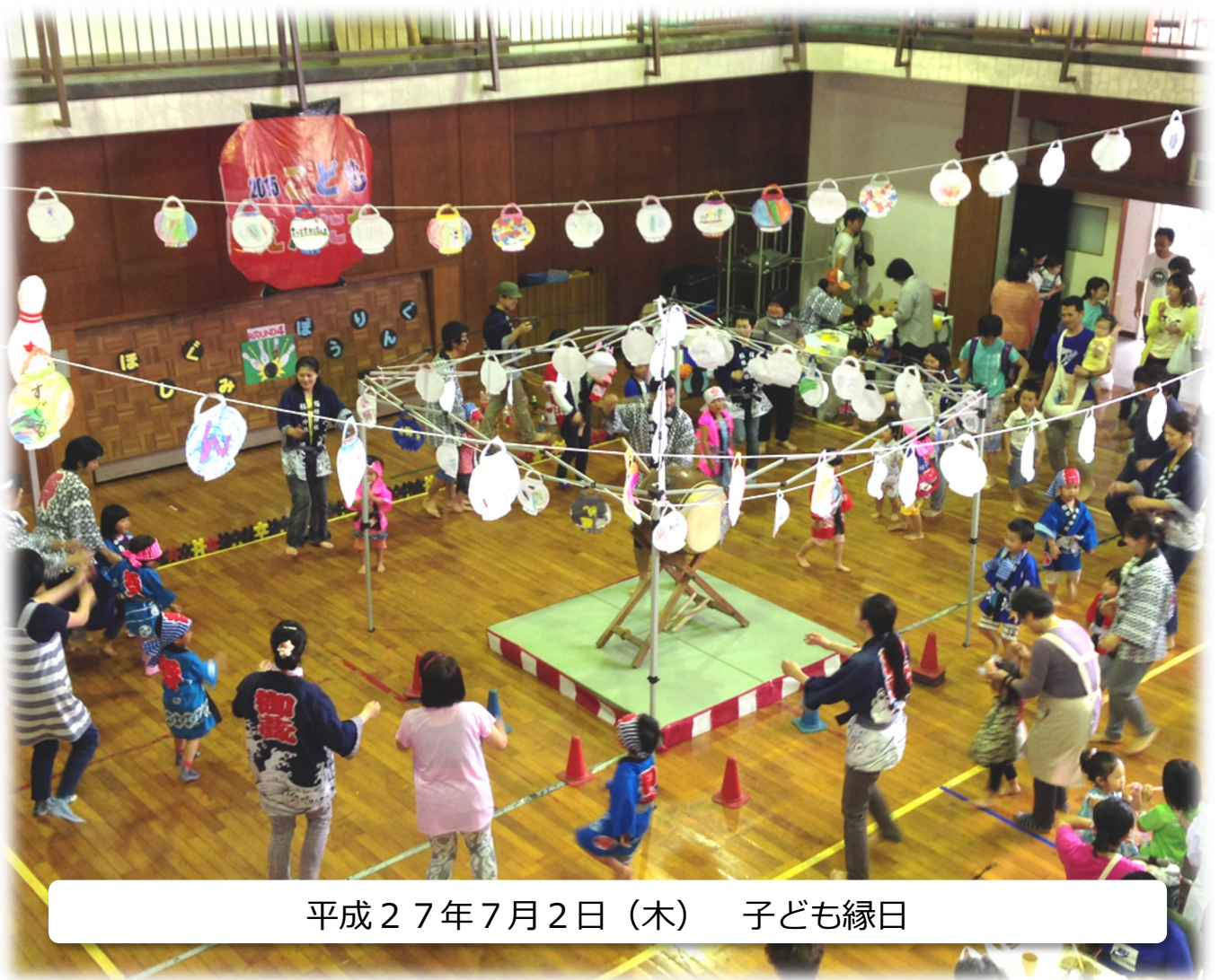
平成27年7月2日（木） 子ども縁日