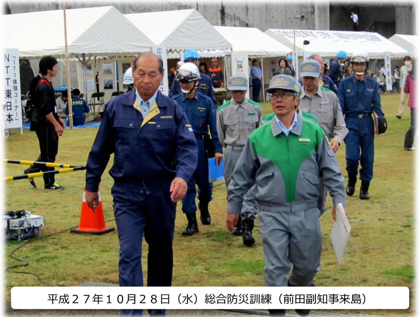
平成27年10月28日(水) 総合防災訓練 (前田副知事来島)