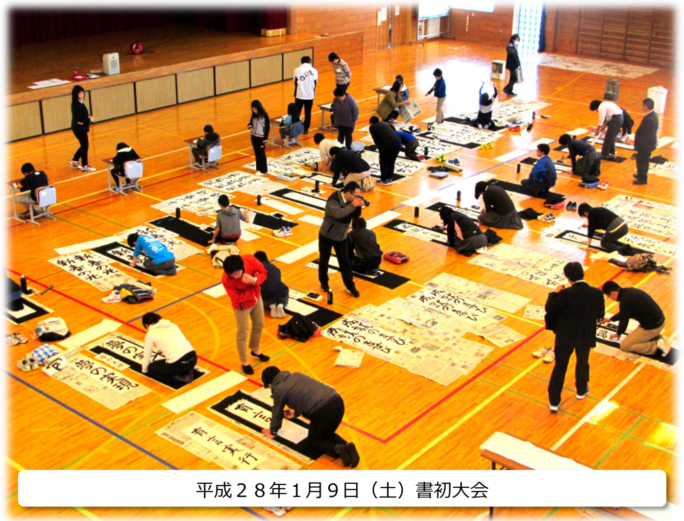
平成28年1月9日 (土) 書初大会