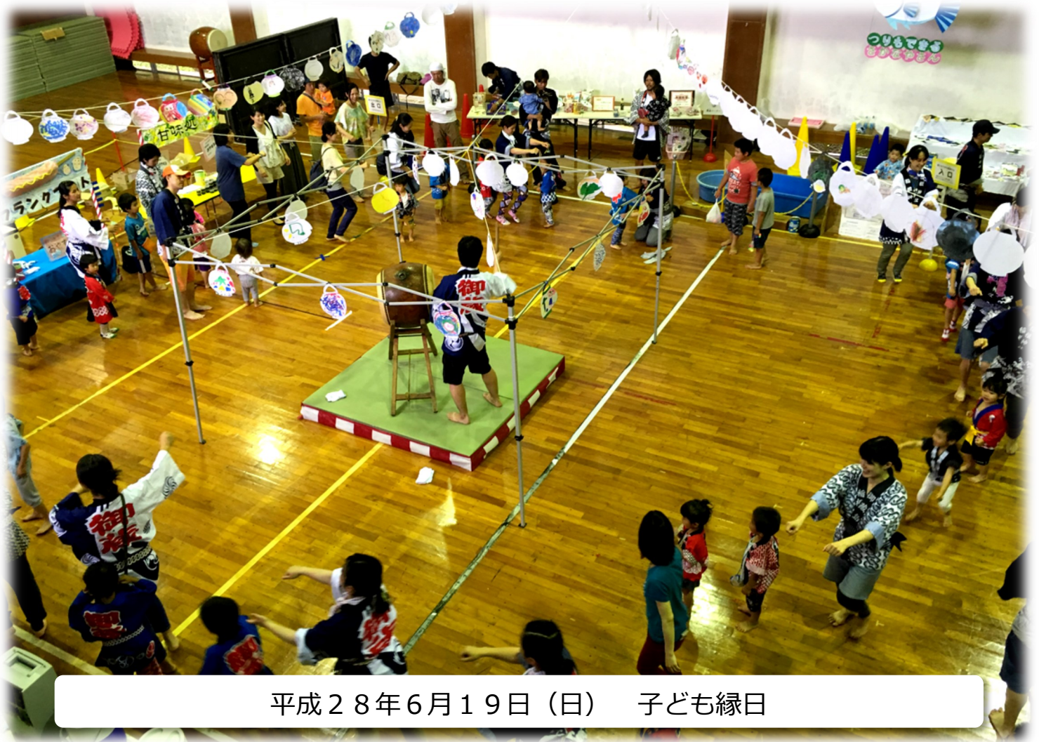
平成28年6月19日(日) 子ども縁日