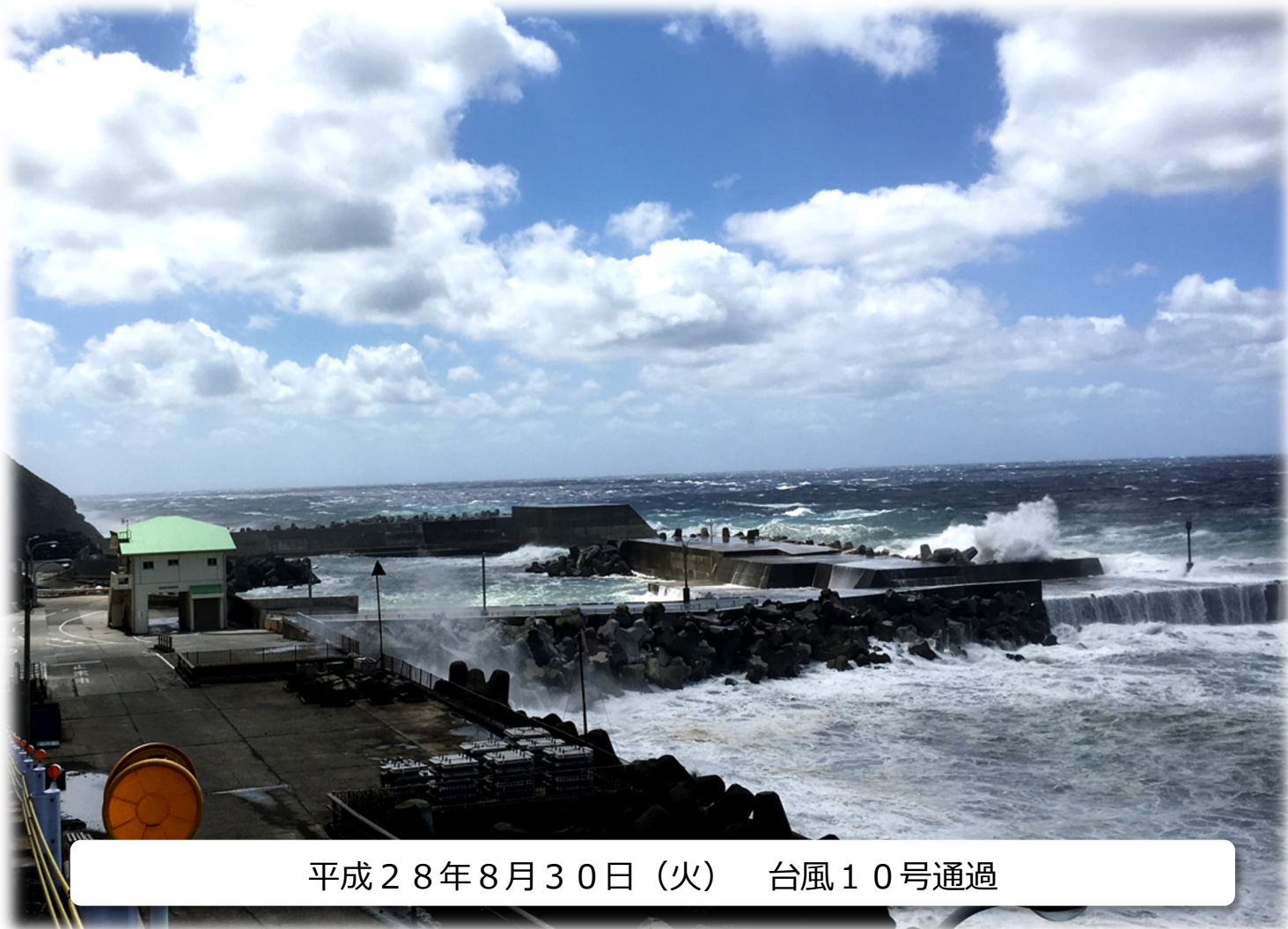
平成28年8月30日(火) 台風10号通過