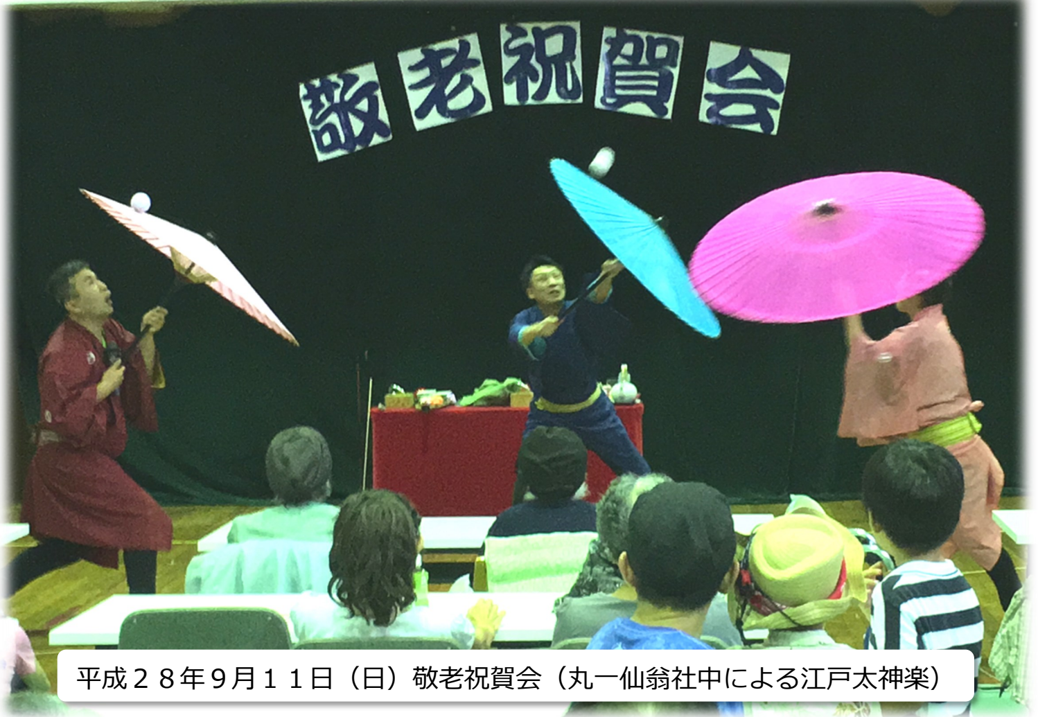
平成28年9月11日（日）敬老祝賀会（丸一仙翁社中による江戸太神楽）