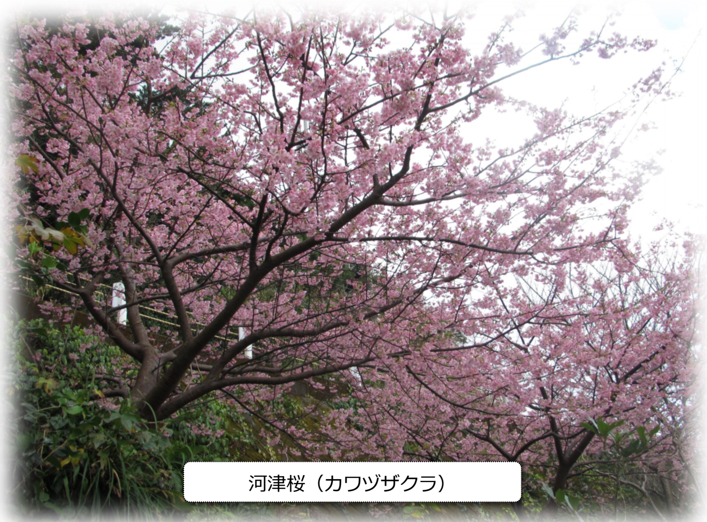
河津桜 (カワヅザクラ)