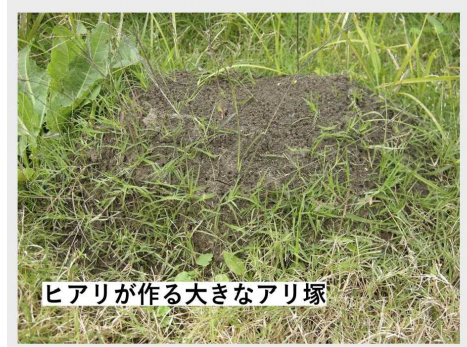
ヒアリが作る大きなアリ塚

南米原産の小さな赤茶色のアリで、土で大きなアリ塚を作り集団で生活する習性があります。攻撃性が強く、棒などで塚をつつくと、集団でワッと出てきて襲いかかります。ヒアリはこれまで日本では見つかっていませんでしたが、6月以降、各地で見ついています。ヒアリの多くは、外国から運ばれてきたコンテナの中や、コンテナを水揚げするコンテナヤードで見ついています。