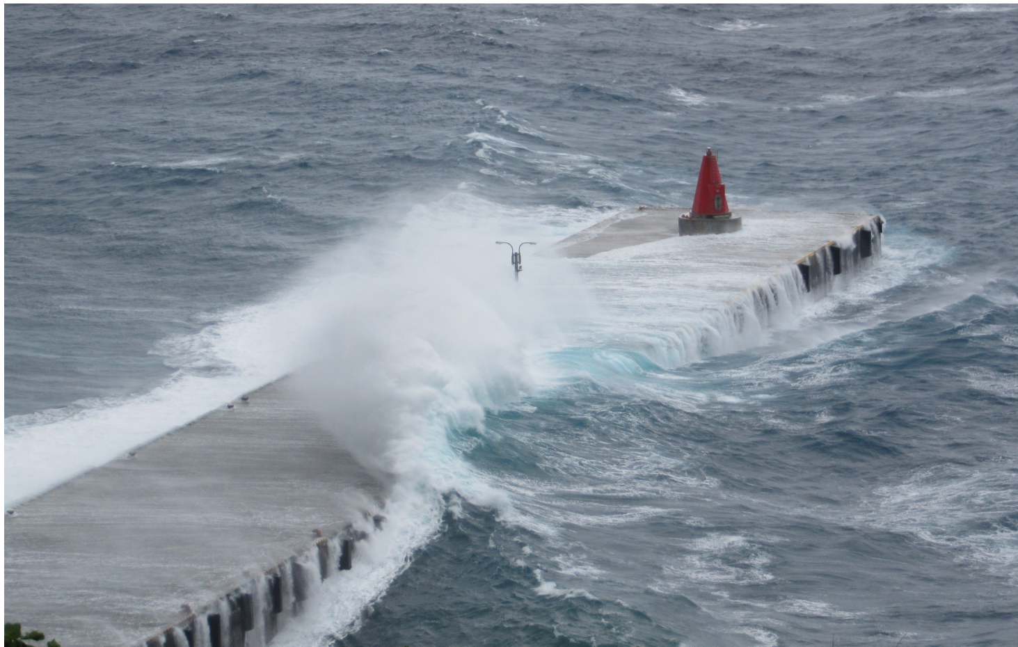
平成29年9月1日（金） 台風15号接近