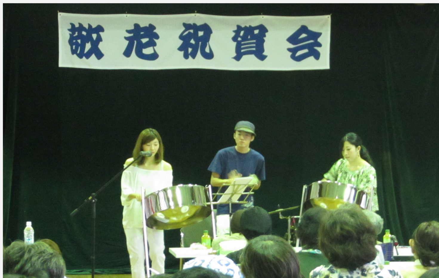
9月24日(日) 敬老祝賀会 (リクロマティックによるスティールパン演奏)