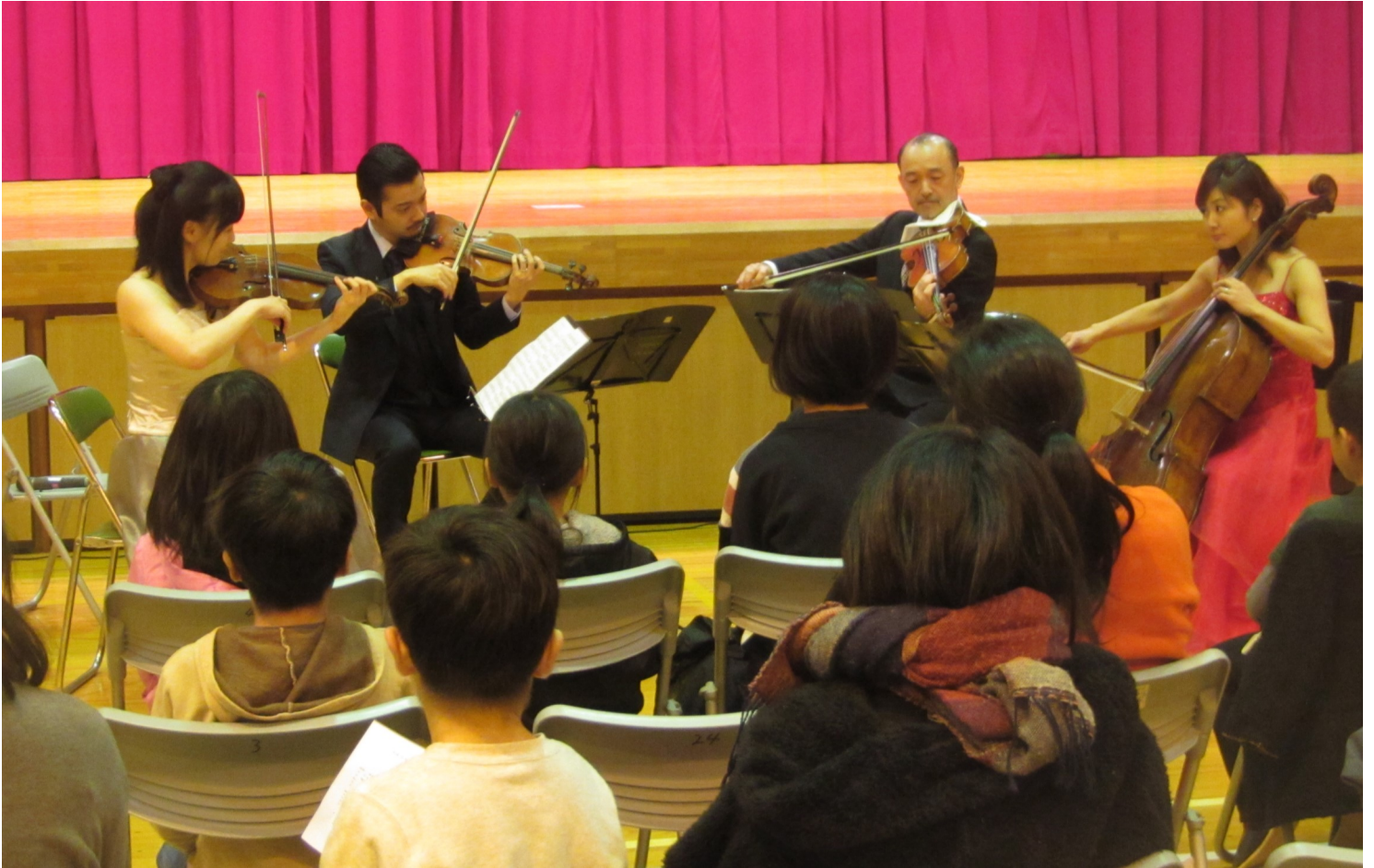
12月2日（土）東京都交響楽団による弦楽四重奏の夕べ