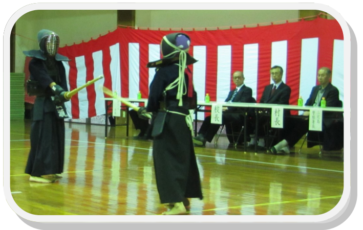
技が決まるたびに、会場には大きな歓声があきました