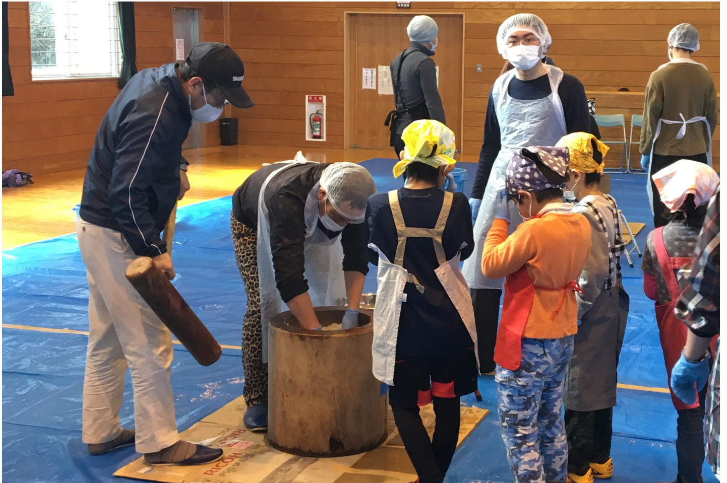
もちつき大会 (平成30年1月21日)