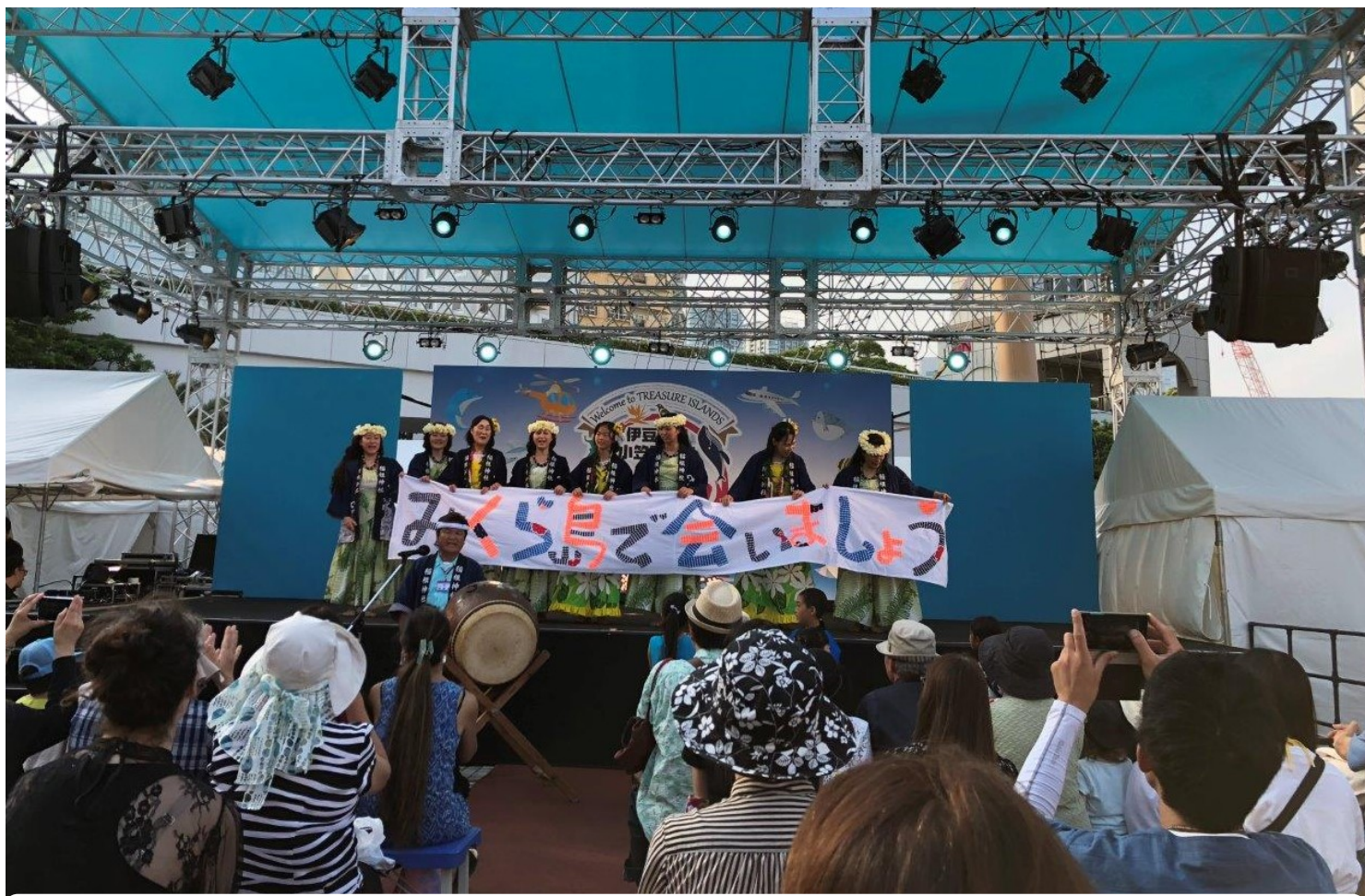
平成30年5月26日・27日 島じまん2018