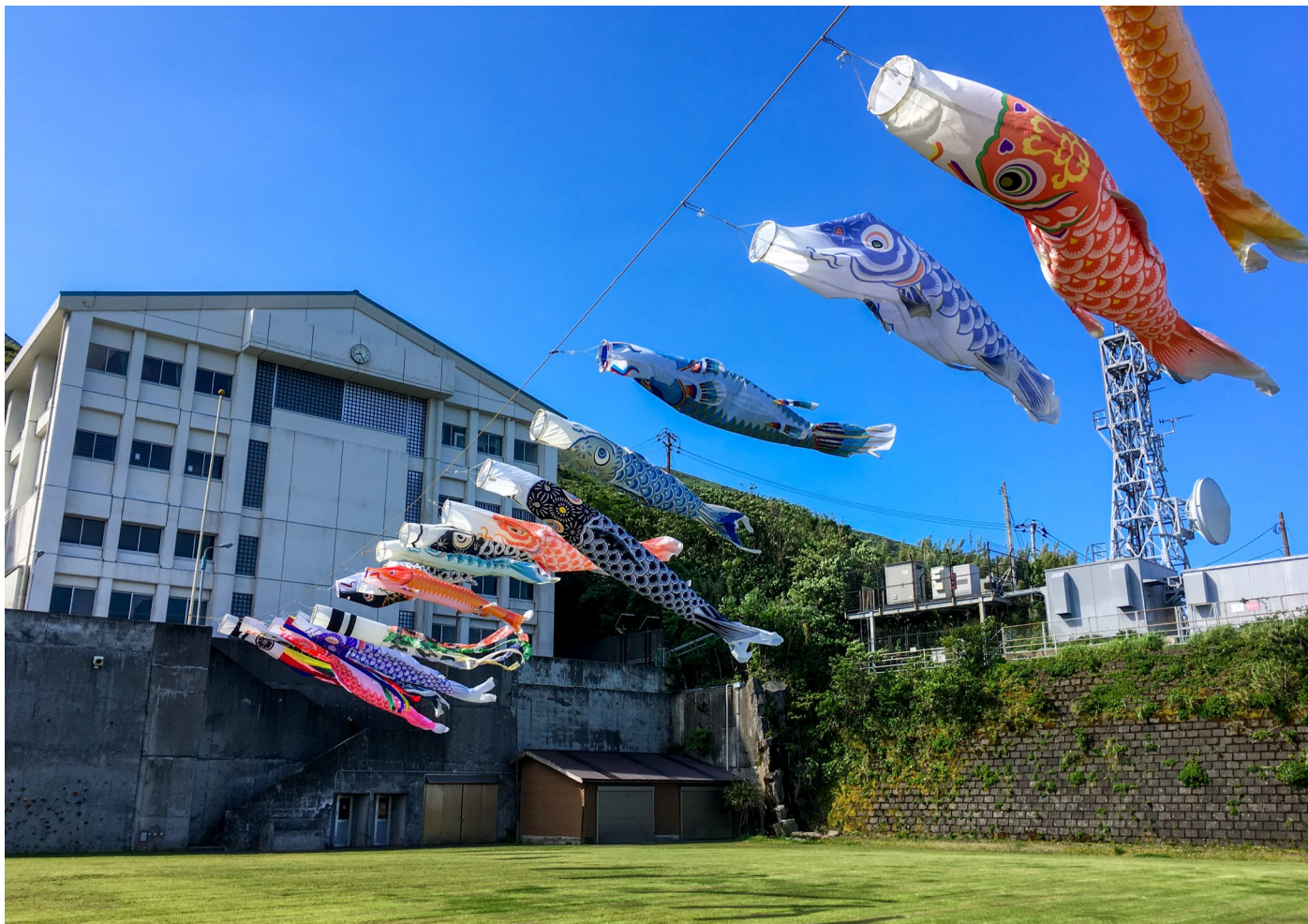
御蔵島小中学校こいのぼり