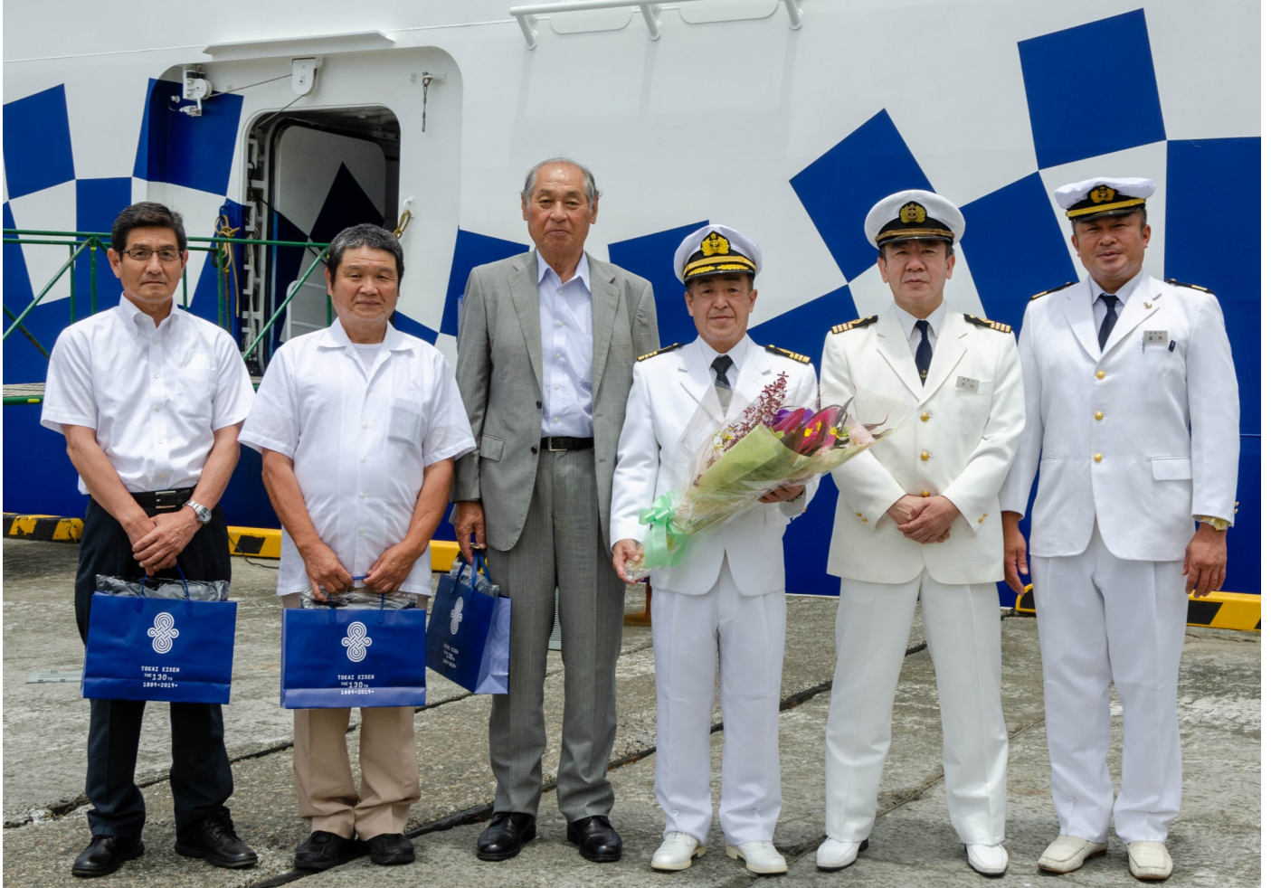
大型客船「さるびあ丸」初寄港