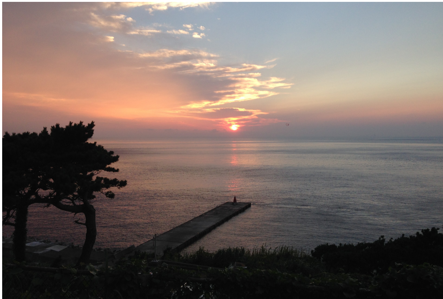
御蔵島港を望む夕日