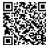
緊急情報配信サービス