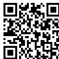
ウォーターセーフティガイド

カヌー、SUP(スタンドアップパドルボード)、ミニボート、水上オートバイや遊泳などのアクティビティについて、誰もが安全に安心して楽しむために知ってほしい情報をまとめた総合安全情報サイトです。