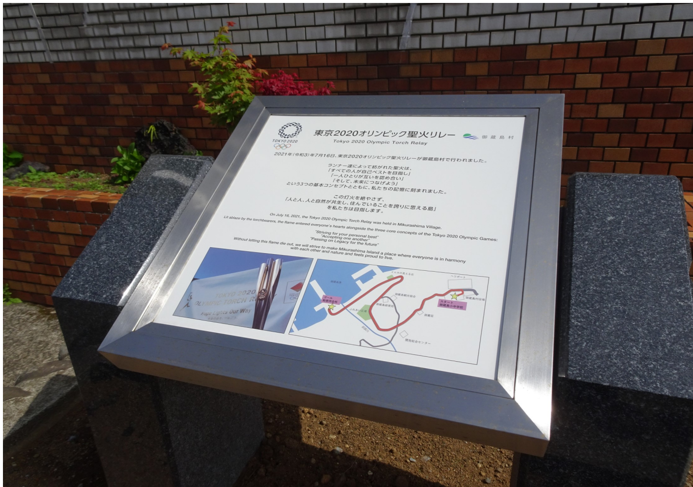
東京2020オリンピック聖火リレー石碑