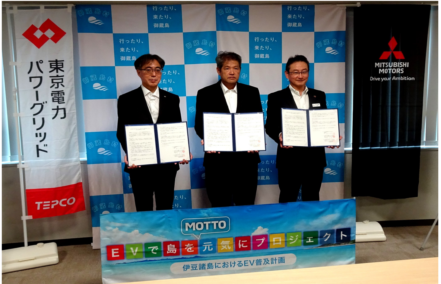
三者協定覚書締結式の様子